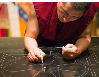
Réalisation à partir du centre vers l'extérieur.

Le mot Mandala vient du sanscrit et signifie le cercle , la sphère , mais aussi désigne l' entourage sacré d'une déité .