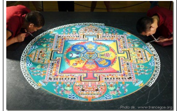
Plus d'une semaine.