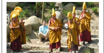
Cérémonie de l'offrande