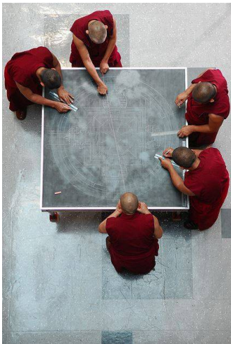
Architecture à base carrée et lignes dessinées à partir du centre.