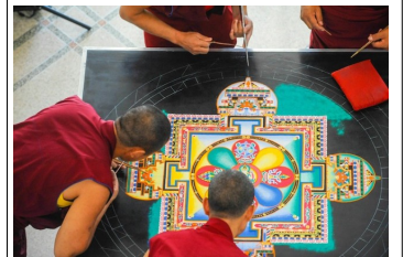
Réalisation qui peut durer de quelques jours à ...