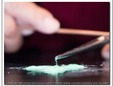
Utilisation du chakpu (long entonnoir) et de la shinga (spatule) par vibration.

« Regarder un mandala se construire, méditer près d'un mandala est très bénéfique pour obtenir le calme mental et retrouver notre équilibre » Institut de Dialectique Bouddhiste de Ngari, Les Éditions du Puits de Rouille