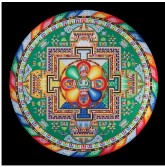
Mandala de la compassion.