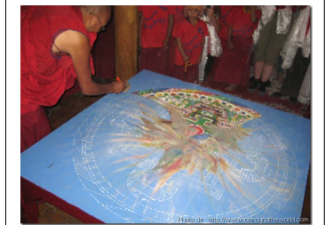
Dissolution du Mandala